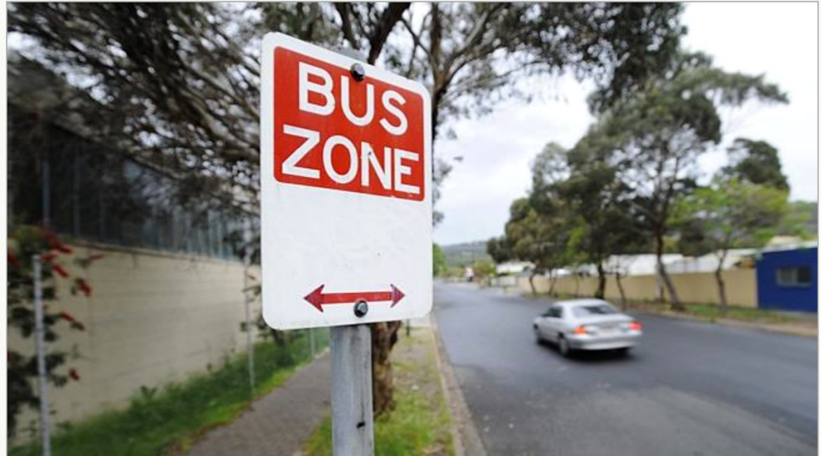
The bus sign on Boothby St in Panorama.